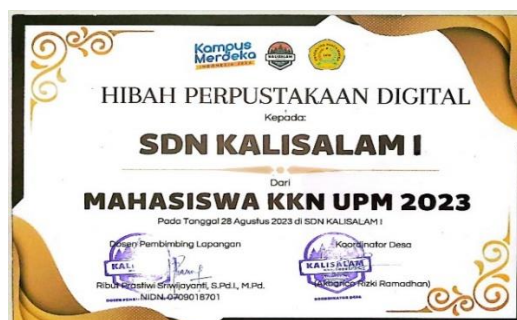
Gambar 3. Sertifikat Hibah Perpustakaan Digital

Guru dan siswa diberikan pelatihan literasi digital untuk memastikan bahwa mereka memiliki keterampilan yang diperlukan untuk mengakses dan memanfaatkan perpustakaan digital dengan baik. Ini bisa melibatkan pelatihan tentang cara mencari dan membaca buku digital. Metode pendidikan masyarakat ini akan memastikan bahwa guru dan siswa di SDN Kalisalam 1 Probolinggo memahami nilai dan manfaat perpustakaan digital yang mereka terima sebagai hibah, dan mereka dapat memanfaatkannya dengan baik untuk peningkatan literasi dan pengetahuan mereka.