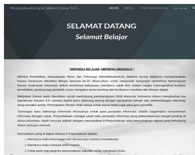
Gambar 4. Tampilan Awal Perpustakaan Digital

Gambar di atas memperlihatkan tampilan awal dari perpustakaan digital SDN Kalisalam 1 Probolinggo. Perpustakaan digital umumnya memiliki beberapa menu utama dan fitur yang memudahkan pengguna dalam mengakses dan menggunakan sumber daya informasi. Pada perpustakaan digital SDN Kalisalam 1 Probolinggo terdapat menu dipojok kanan atas yang berisikan home, profil, visi misi sekolah, dan lainnya. Pada menu lainnya, terdapat submenu berupa perpustakaan digital (berisikan buku-buku seperti buku kurikulum merdeka), berita, hubungi kami, dan Q&A. Menu-menu ini dapat bervariasi, tergantung pada platform dan penyedia layanan. Menu perpustakaan digital SDN Kalisalam 1 Probolinggo dapat diubah dan dirancang sesuka hati, sesuai kreasi pustakawan ataupun