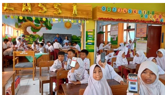
Gambar 2. Pelatihan Cara Mengakses Perpustakaan Digital

Metode pengabdian ini menguraikan cara penyelesaian masalah, yaitu menggunakan metode pendidikan masyarakat, berupa penyuluhan pemahaman serta kesadaran guru dan siswa tentang pentingnya kegiatan literasi. Dan melakukan pelatihan khusus bagi siswa tentang cara menggunakan perpustakaan digital seperti cara mengakses e-book , serta pelatihan terkait dengan keterampilan dalam menggunakan teknologi, yaitu tata cara guru dalam menjalankan website digital library .