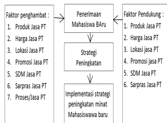
Gambar 4 : Kerangka Pikir hasil implementasi penelitian

Setelah dilakukannya berbagai strategi diatas dan didapatkan data sampai bulan September 2017 yaitu informasi bahwa mahasiswa yang mengikuti tes penerimaan mahasiswa baru terdapat kenaikan tetapi cukup kecil jauh dari yang diharapkan. Pada periode berikutnya diharapkan penerimaan calon mahasiswa baru semakin meningkat lagi dengan diterapkannya program-program baru tersebut diatas.