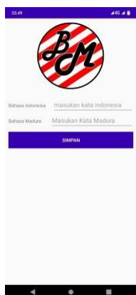
Gambar 8 Tambah Kosa Kata

Tampilan tambah kosa kata, lebih jelas lihat gambar 8 di bawah ini