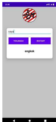
Gambar 7 terjemah

Pada gambar 7, penulis mengisi kosa kata di edit text lalu klik button terjemah maka akan muncul arti yang di cari ke dalam text view di bawah button terjemah. Button restart berfungsi untuk mengembalikan semua kepada awal.